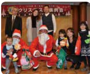
サンタからのプレゼント