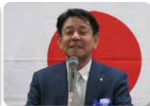
ライオンテーマ L 太古博章