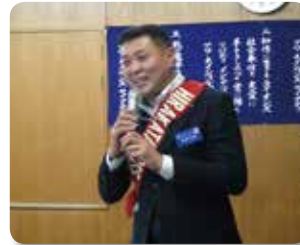
テールツイスター L 吉野