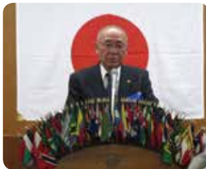
大塚会長あいさつ