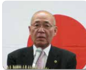
大塚会長あいさつ