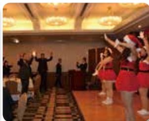
みんなでダンスショー