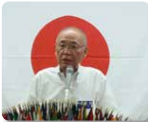
大塚会長あいさつ