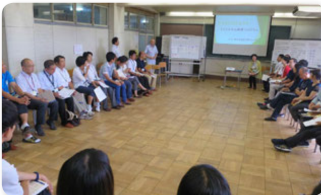
■ ライオンズクエスト